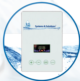
O 3 System