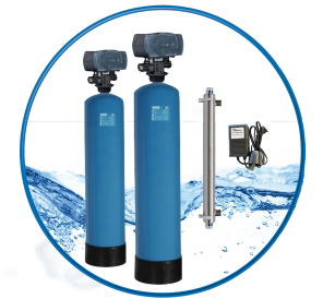
Sello de Oro