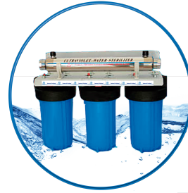
Home Healthy 3