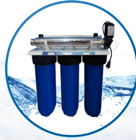
Home Healthy 5